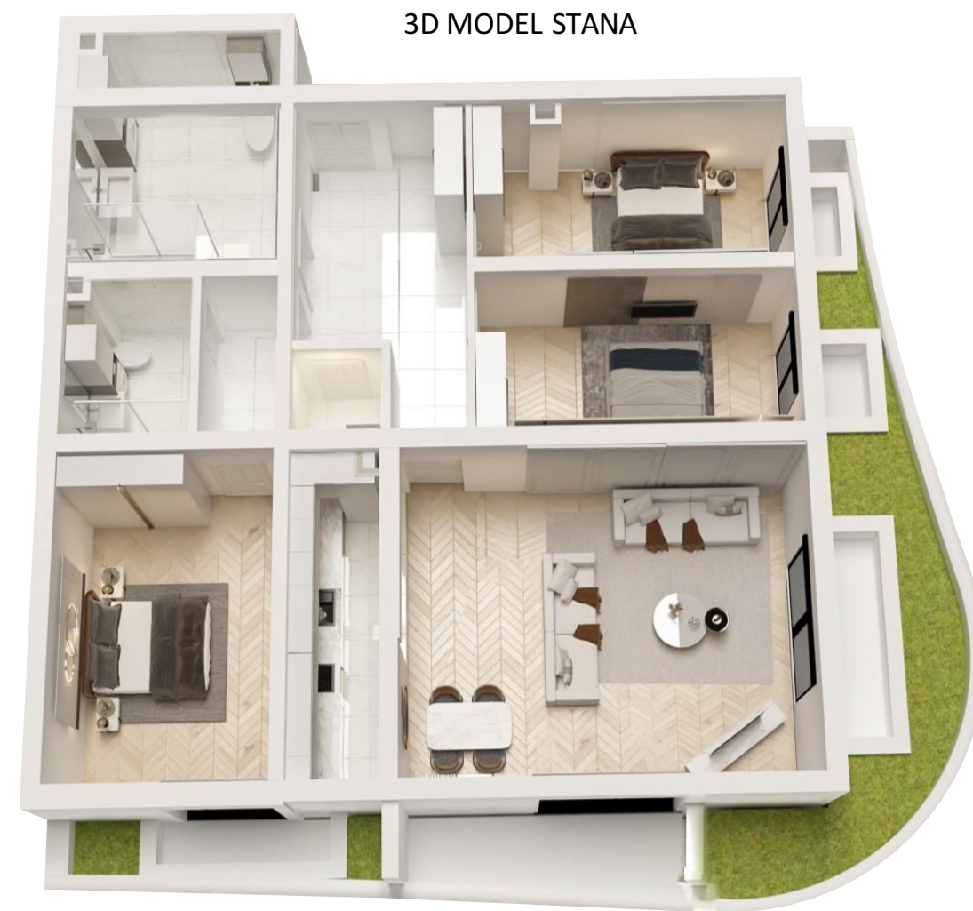
3D MODEL STANA